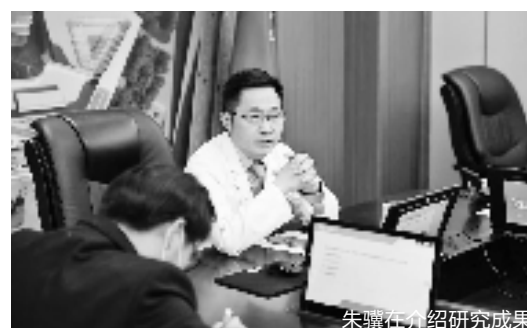
朱骥在介绍研究成果

近年来,直肠癌发病率不断上升。“我们在临床中遇到很多低位直肠癌患者,他们在保命和保肛之间纠结。”国科大肿瘤医院副院长、腹部放疗科主任医师朱骥团队进行了两种药物用于直肠癌新辅助放化疗的三期研究,这项研究结果已经被写入2021年中国临床肿瘤学会(CSCO)结直肠癌诊疗指南、中国肿瘤整合诊治指南(CACA)直肠癌整合诊治前沿,成为该领域最新研究参考。研究表明,两种药物合理运用于直肠癌新辅助放化疗,可以将这类患者的肿瘤减小,从而获得能保肛的手术机会,甚至实现肿瘤消失,不需要再进行手术。目前已有80多位低