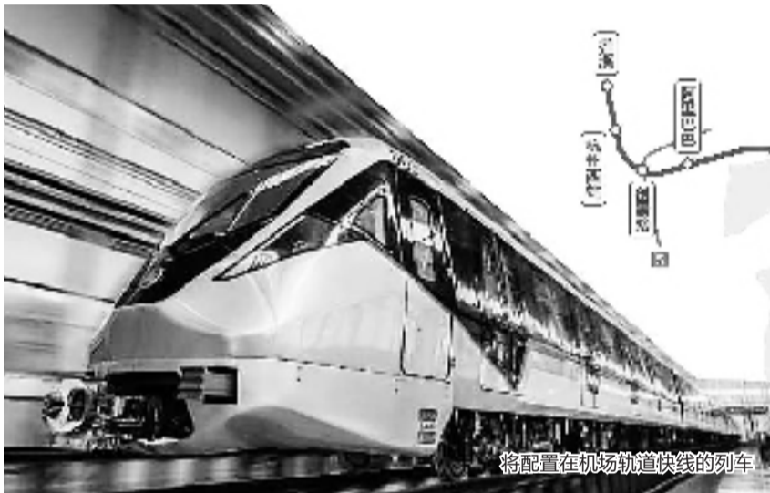
将配置在机场轨道快线的列车