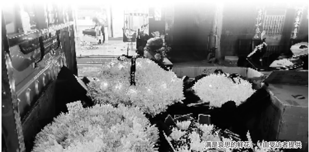
满是哀思的鲜花