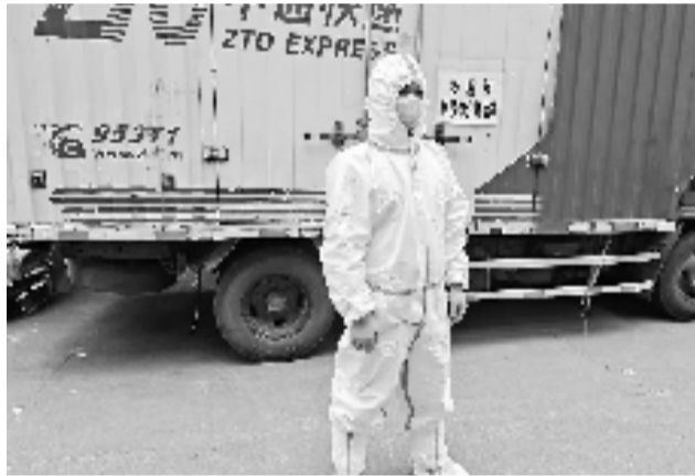
中通小哥加入物资保供配送

“这和平时接单送乘客相比有很大区别,以往出车时间自己掌控,而现在要时刻待命,准备好随时出发,来应对