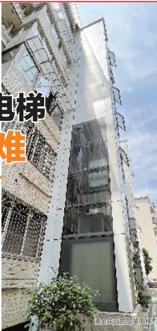
涌金花园的加装电梯

“望楼却步”是不少居住在老小区的老年人每天头疼的生活难题。加装电梯的出现,让老人们看到了希望。这几年,加装电梯都被列入杭州市政府的十大民生实事项目。截至目前,杭州市已累计完工 3562 处加梯项目,共惠及住户 4.2 万余户。