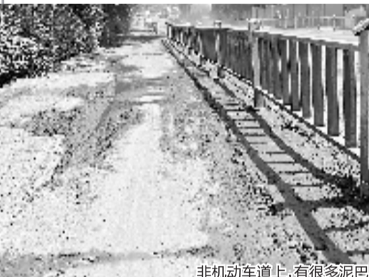
非机动车道上,有很多泥巴