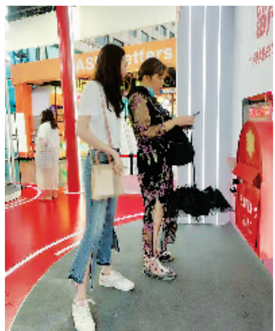
2020年9月17日,分行营业部青年员工在“万物工享, @未来”活动上指导客户体验

面对盛会,杭州分行营业部营业室积跬步,致千里,一步步引导青年员工发挥才智,投身于亚运工作中,为服务盛会注入青春力量,提升员工参与亚运的自豪感和责任感。杭州分行营业部营业室搭建了一个学习、参与、创新、服务的平台,并通过选拔、培训等方式,组建了外语人才、印象+、创意+三支团队,多角度助力亚运金融服务,如“益起来捐步”、倒计时两周特设游园会、主题之夜演出、斯巴达勇士赛、国际文明礼仪大赛……在亚运的精彩时刻,三支团队相伴同行,成为工行服务亚运的亮丽风景线。