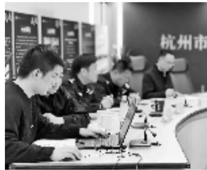
杭州市疫情防控办场所码专班

场所码屏底部“帮扫·杭州的温暖”点击进去,四叶草形式分布着四个功能:身份证OCR识别、市民卡输入卡号、扫描健康码、健康码代办。具体操作也很简单。