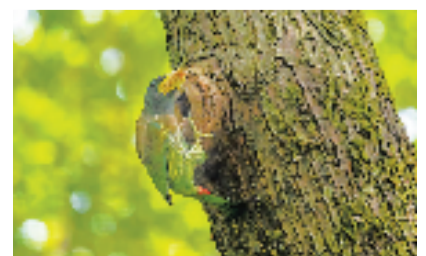
大拟啄木鸟筑爱巢。好摄之友@阿仔顺法