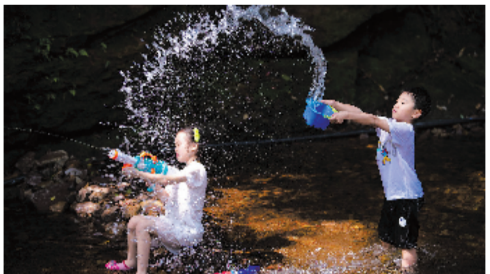
夏日的清凉。好摄之友@天马行空