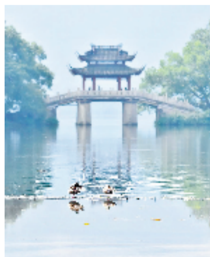
初夏,玉带彩虹桥。好摄之友@辰曲 16