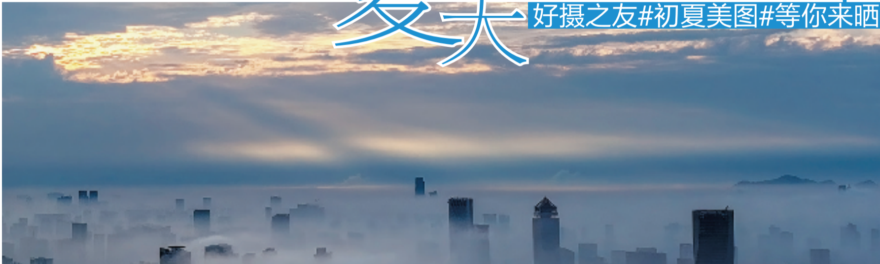
清晨,大雾中的杭城如海市蜃楼。