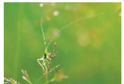
草螽爬上草尖。好摄之友@辰曲 16