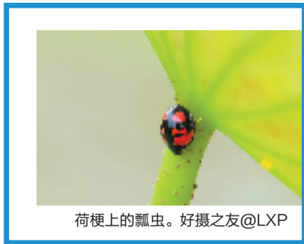
荷梗上的瓢虫。好摄之友@LXP