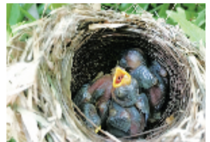
一窝小鸟嗷嗷待哺。好摄之友@映雪