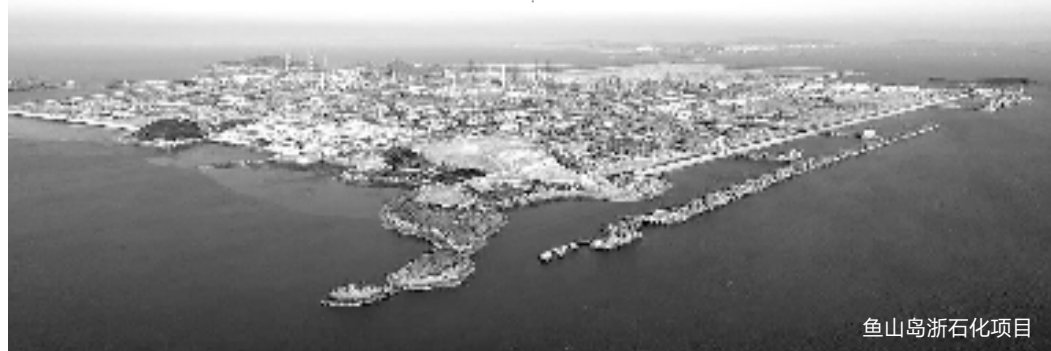
鱼山岛浙石化项目

接下来,省特科院还计划设立舟山绿色石化检验基地,成立石化装置检验所,作为常驻机构为浙石化项目提供就近、便捷、一站式的技术服务。当遇大项目或应急情况该所无法独立承接时,院将统筹调配全院力量予以支援。