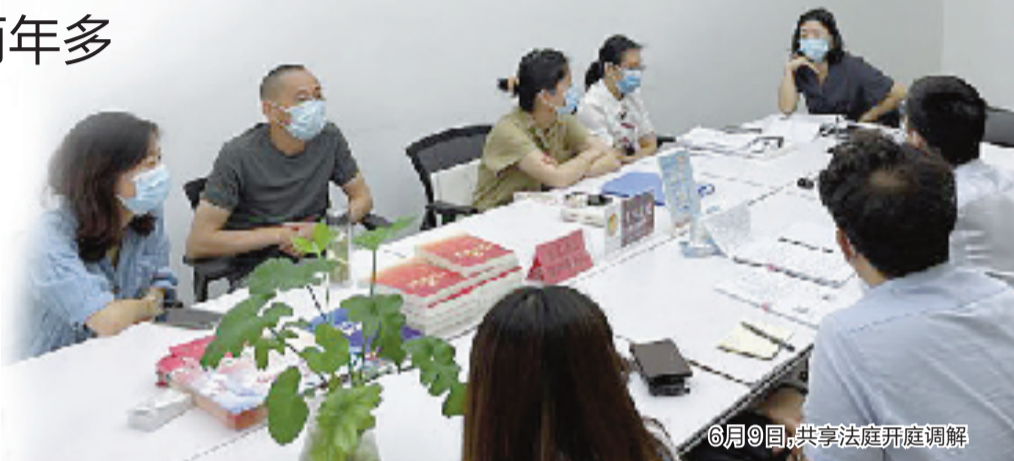
6月9日,共享法庭开庭调解