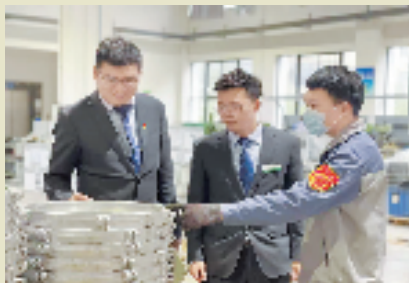
农行温州永嘉县支行客户经理走访海星海事电气集团有限公司,为企业提供金融帮扶

面对疫情严峻复杂形势给市场带来的影响,海星海事却逆势“长”出一条上扬的生命线。截至5月末,该公司今年销售额已同比上涨约20%。一升一降,已然描绘出企业信心的模样。