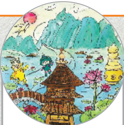
采桑子·群芳过后西湖好 宋·欧阳修 群芳过后西湖好,狼籍残红,飞絮濛濛。 垂柳阑干尽日风。 笙歌散尽游人去,始觉春空,垂下帘栊。 双燕归来细雨中。