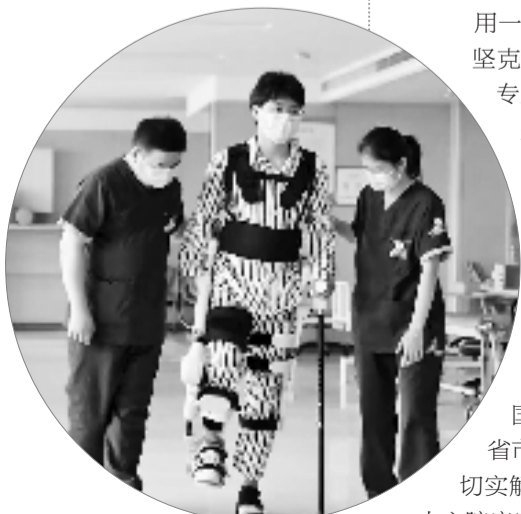
为患者量身定制以精准神经调控康复和职能训练为主线的康复计划

首创国内以血管为特色的标准化代谢病中心,融合心血管、脑血管、下肢血管、肾内科、眼科等大血管和微血管病变相关科室,从学科交叉走向学科融合,践行“一个中心、一站服务、一个标准”的核心,创建代谢相关心血管疾病管理新体系,对患者进行全程、闭环、个体化代谢病管理。