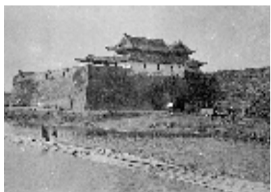
旧时庆春门

同一天的回忆录里,他对杭州的城墙作出了详细的叙述:“在唐朝的公元891年,杭州最古老的城墙(始建于隋朝的公元606年,全长36里或10英里)被扩建到了70里或20英里。在12世纪的南宋时期(公元1159年),杭州的城墙似乎又继续扩建到了全长100里(按照马可·波罗的说法),或大约30英里。到了14世纪中期继元朝之后的明朝,它们又被缩短到了12英里,或是恢复到了跟最初的城墙差不多的长度。”