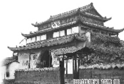
旧时钱塘门