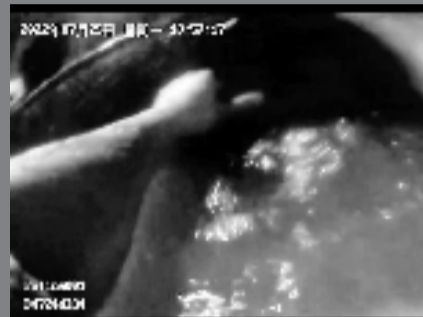
民警用力拉开车门