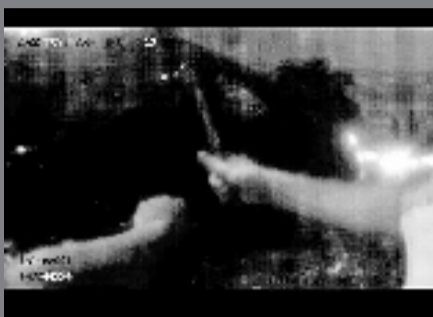
民警用锤子敲碎车窗玻璃