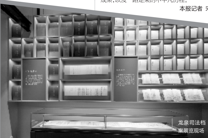
龙泉司法档案展览现场