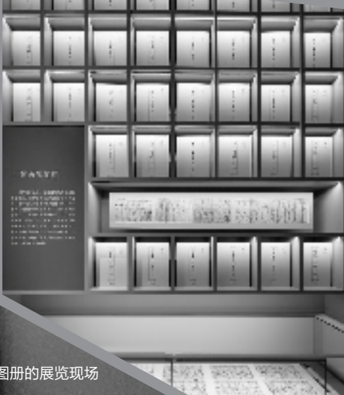
兰溪鱼鳞图册的展览现场