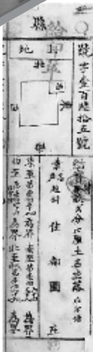
▲兰溪鱼鳞图册中的“号字165号”内容。