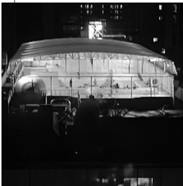
夜里10点多仍然在营业的轮滑馆