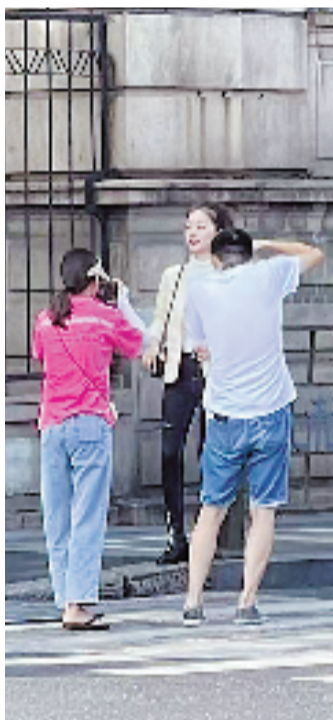
模特儿在拍摄秋装

2022,对于四季青的每一个人来说,是特殊的一年:春季疫情加上夏日的极端高温,每位摊主都在拼出全力。在今年这最后的100多天里,大家都在等待着一个漂亮的逆袭——相信,这也是每一个上半年过得不易的人们的共同心愿。