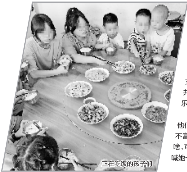
正在吃饭的孩子们

每到寒暑假，很多家长会对出笼的“神兽”感到无所适从，不知道该如何相处。可大人们未必知晓，孩子们更怕没人陪伴的日日夜夜。