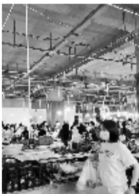
菜市场里的成都人

据《成都发布》消息,成都农产品中心批发市场目前供应充足,蔬菜日均供应量约4000吨,肉类日均供应量约600吨,水产海鲜日均供应量约1000吨,米面粮油等副食品储备量约6000吨。市场现已规划应急保供场地,作为城市生鲜农产品中转集散地使用,以保障城市应急供应,能满足市民日常需求。