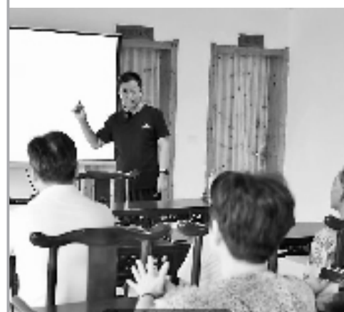
宣讲员给村民上课