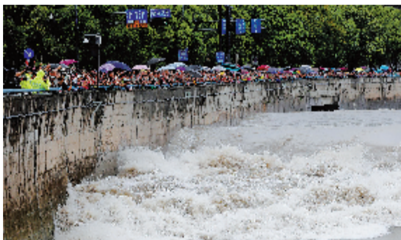
九溪,钱塘江大潮。