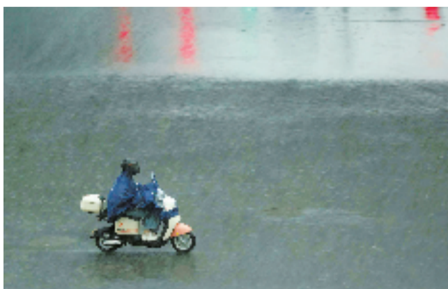
台风来袭,大雨中骑行的人。