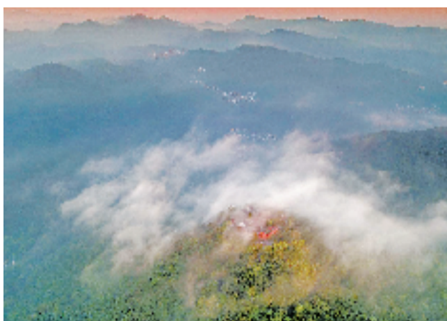
秋日薄雾玉皇宫。@阿乐头