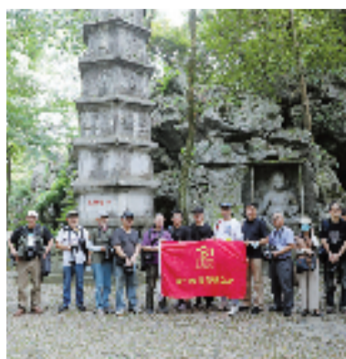
好摄之友灵隐采风行。