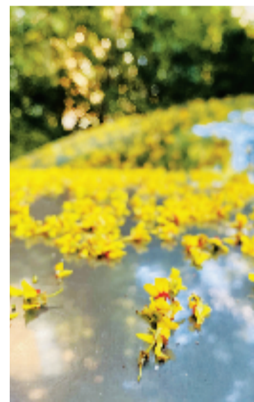
车顶上,落英缤纷。@耳东