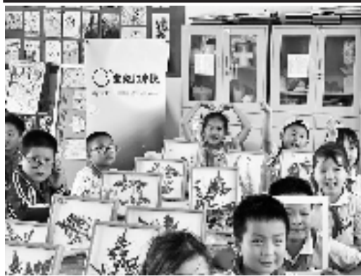
孩子们自己动手做标本