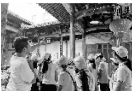
在家厅,带着孩子认识古建筑