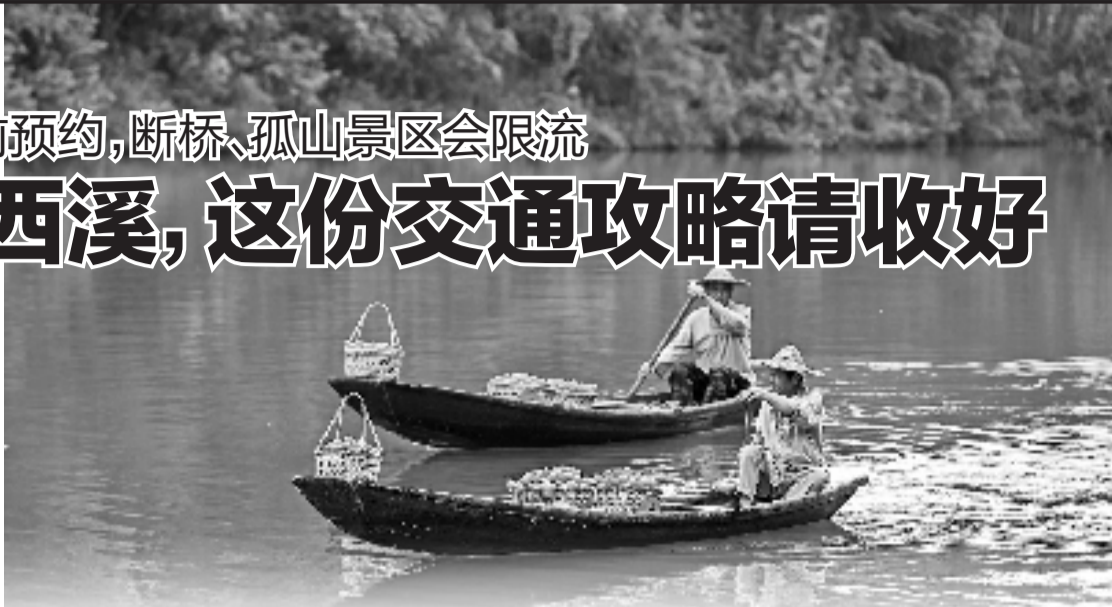
西溪湿地火柿节正在举行

西湖西溪景区的相关负责人透露,今年中秋小长假,西湖西溪景区人流量比去年增长了40%左右,预计今年国庆节的人流量也会比去年有所增加,建议大家进入西湖、西溪景区尽量绿色出行。