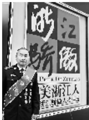
□ 本报记者 高华生

全国高职院校教学能力大赛一等奖,全国高校微课教学一等奖(注:两个奖项是教育部教师教学比赛最高奖),浙江省黄炎培职业教育杰出教师奖,最美浙江人,入选浙江省“151人才工程”,荣立个人二等功2次……类似的荣誉郑孙勇早已收获很多。不过,这次郑孙勇接受采访是以另一个身份——杭州亚运会克柔术项目竞赛主任(竞赛副指挥长)。