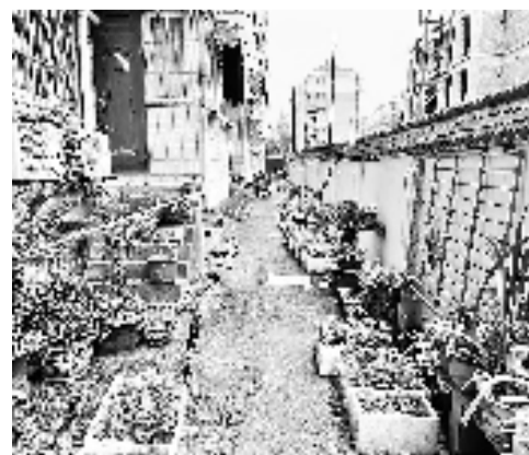
地面裂缝清晰可见。

记者从属地街道了解到,这周将会召开一次协调会,届时将邀请包括小区居民在内的代表参加,“协调会的内容主要涉及隔壁工地施工的影响,老旧小区改造的问题以及周边产权单位的协调。会上居民提出的合情合理的诉求,将会给予回应。”