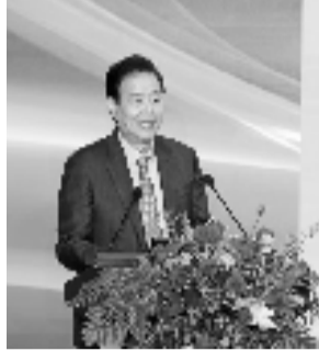
姚克教授在主场作报告

12月10日上午,西湖国际眼科学术论坛暨浙江大学眼科医院启用周年庆典在浙江大学眼科医院(杭州)召开。1996年,浙大二院眼科中心成立,依托百年名校浙江大学、百年名院浙大二院的雄厚积淀,在姚克教授的带领下走出了“跨越式、高质量”的发展道路。2021年12月,浙大二院眼科中心迁址浙江大学眼科医院,一年来,医院在医疗、科研、教学上均实现突破性增长,成绩卓然。