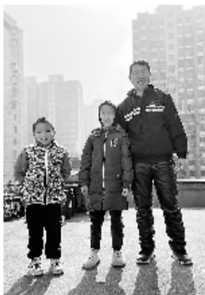
在租房阳台,记者给他们拍新年第一张合影

容。他说,2022年是最近几年他过得最幸福最忙碌也最踏实的一年。“最大的感动来自于钱江晚报和热心人的鼓励。”