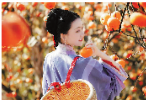
柿子红了。