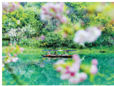
乌龟潭晚樱。好摄之友@月亮