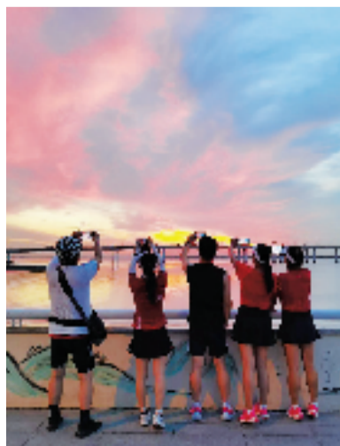
夏日雨后的晚霞。好摄之友@春树暮云