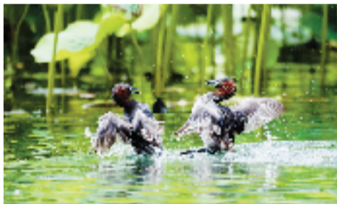
小鸊鷉的夏日清凉。