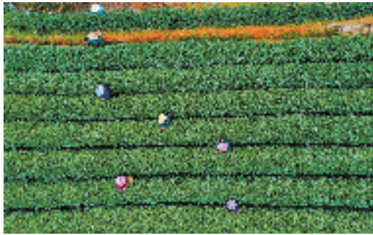
采茶时节的龙坞茶乡。