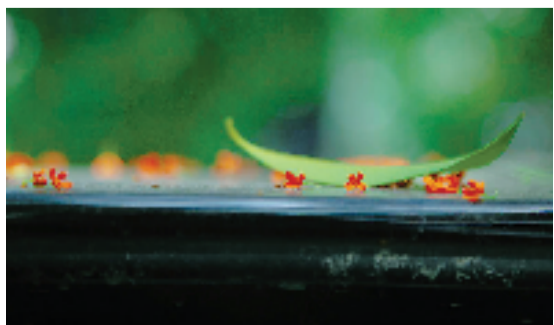
十月金秋桂花开。好摄之友@芦苇