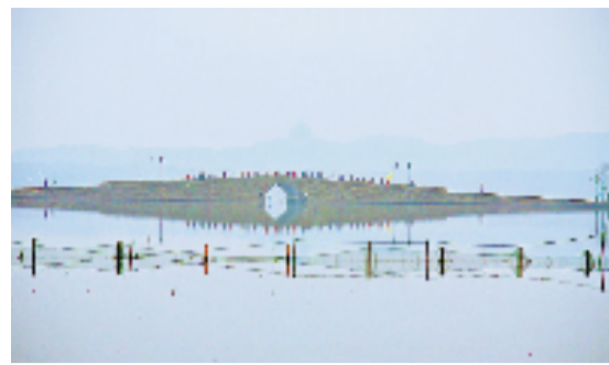
初冬西湖。好摄之友@再回首