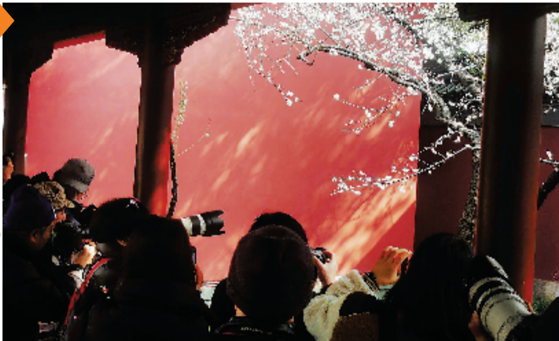
钱王祠拍梅网红地,被各种镜头抢占机位。