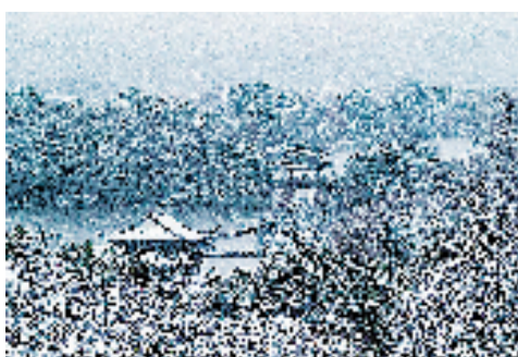
雪中远眺西湖。