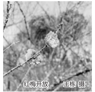
红梅开放

良渚文化村社区工作人员专门统计过,光通过社区层面预订,先后就有170多人次过去吃饭,一共在村里带动了20多万元的消费。