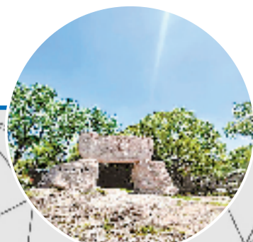
河姆渡遗址博物馆

今年恰是河姆渡文化发现 50 周年,让我们再次走进河姆渡,感受江南饭稻羹鱼、鱼米之乡的富饶和文明,寻觅古老年代的科技和创新。