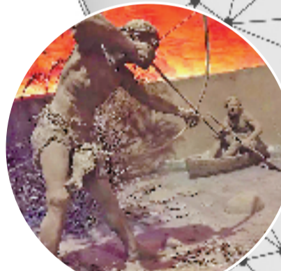
河姆渡人生活复原场景

农耕稻作文化,也一直是河姆渡遗址博物馆致力推广的科普内容。为了加深青少年对水稻文化知识的理解,他们经常将稻作农业科普、水稻科普讲座送进教室,让孩子们眼界大开。