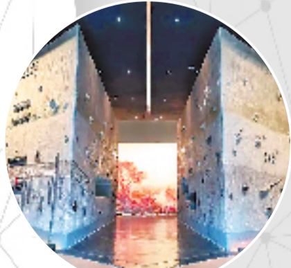
河姆渡遗址博物馆

河姆渡遗址于 2021 年入选全国“百年百大考古发现”,不久前又入选了第四批国家考古遗址公园立项名单。馆长谢向杰说,进入立项名单,是扩大“河姆渡”版图的一个信号。随着近些年浙江史前文化考古发掘的跨步发展,包括井头山、施岙等遗址的发现,河姆渡文化在新时代有了更大的意义。