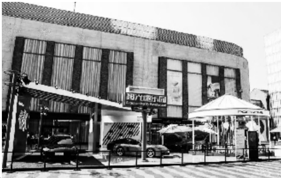
杭城街头的一处户外商业活动

钱江晚报官微推送这一消息后,阅读点击量迅速突破10W+,网友纷纷文后留言,“啥时摆出来,好想感受这份烟火气。”还有网友好心提醒,“要限制噪音,不要超过规定的分贝。”