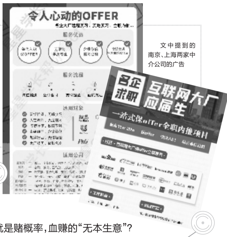
文中提到的 南京、上海两家中介公司的广告

这种打着“全职内推”“精准就业”的中介公司,服务行业已涵盖互联网、广告传媒、快消、投行咨询等多领域。我们的调查,可能只是揭开了小小的冰山一角。