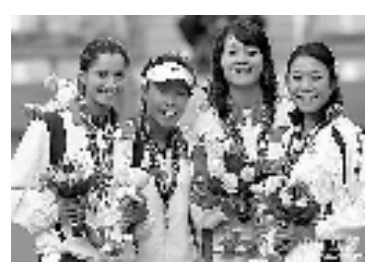
郑洁力克印度选手米尔扎,摘得网球女单金牌,李娜和日本选手中村兰子并列第三名。

作为东道主,卡塔尔代表团最终获得9金12银11铜32枚奖牌,虽然在金牌榜上仅排在第九,但他们不仅拿下最重要的金牌,而且就此开启了卡塔尔足球新时代。