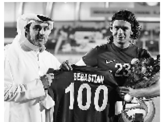
塞巴斯蒂安·索里亚是卡塔尔国家队的头号归化球星。

借着多哈举办2006年亚运会的契机,名为阿斯拜尔的体育精英学院应运而生,当时阿斯拜尔作为体育设施联合体是世界上最大的体育运动训练中心,也是多哈亚运会多个项目的比赛场地。整个学院耗资