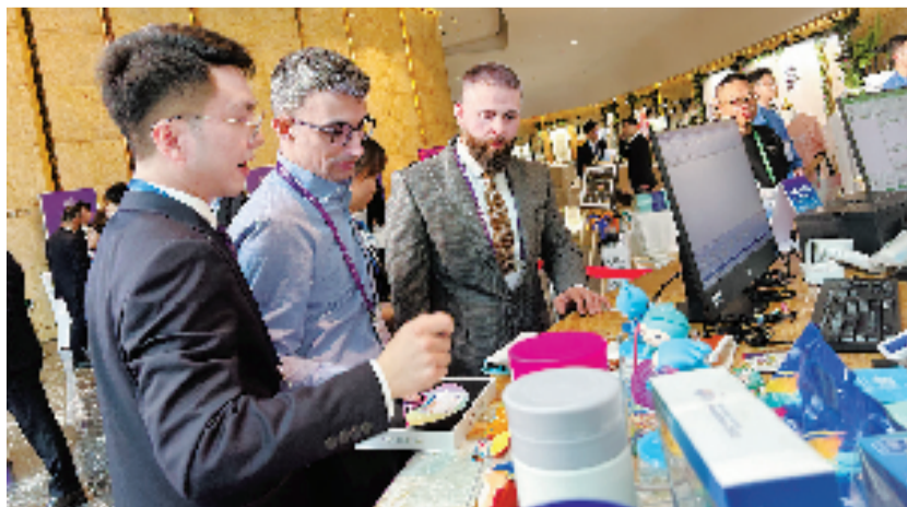
▲杭州亚运会代表团成员现场体验工行数字人民币硬件钱包

此次杭州亚运会代表团团长大会,工行将进一步了解代表团需求,下一步将整合自身在服务、科技、人才和品牌等各方面资源,在杭州亚运会召开期间,为各国运动员、工作人员、赛事观众等提供便捷、高效、安全的全方位金融服务,共同为实现“绿色、智能、节俭、文明”亚运增光添彩。