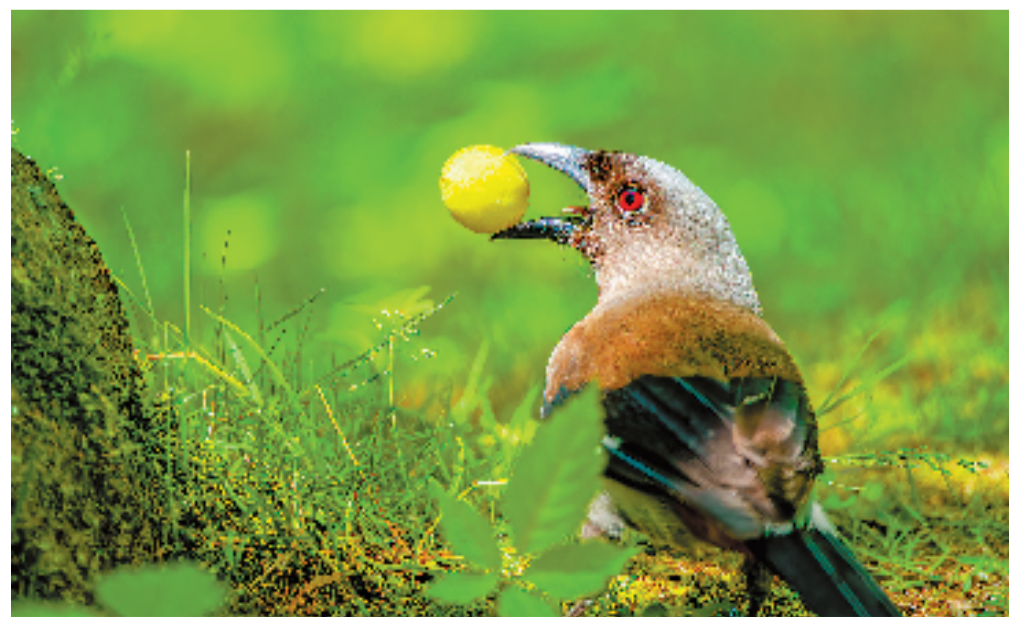
灰树鹊叼走了一粒