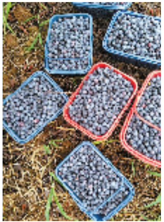
吃蓝莓的季节到了