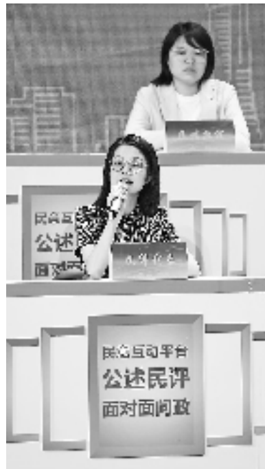
公述民评现场

办事大厅黄牛在窗口兜售代办业务、公开电话始终无人接听，刚注册完个人信息就遭泄露……昨天的问政现场，对杭州营商环境的把脉问政持续了近3个小时，共曝光了25个问题。