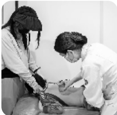
儿科护士为小朋友做扶正阳气治疗助长高