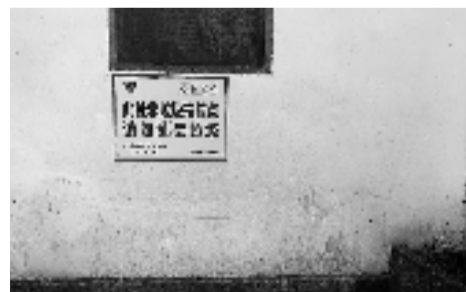
社区在非垃圾投放点贴的告示牌