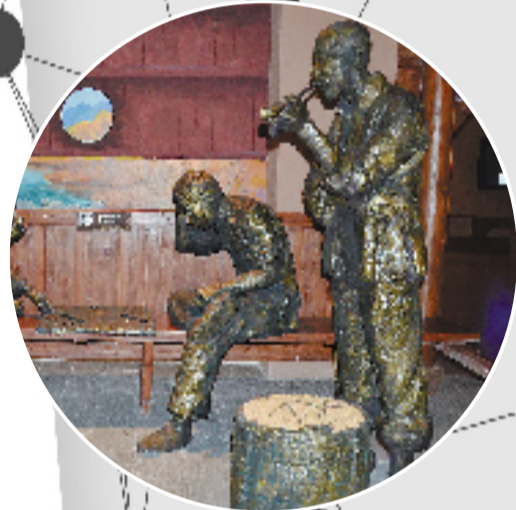
廊桥博物馆展厅场景——廊桥休闲娱乐活动

成立于2011年,2020年11月6日与庆元县香菇博物馆合并为庆元县博物馆,现发展为集文化展示、科普宣传、服务、研究、收藏、交流为一体的“一体两馆”的格局,是第七批浙江省科普教育基地。