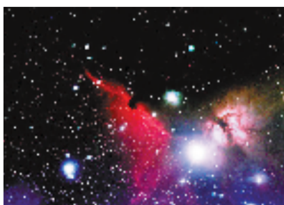
猎户座大星云