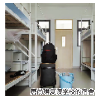
唐尚珺复读学校的宿舍