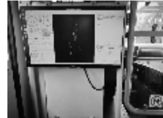
车内实时显示的控制系统