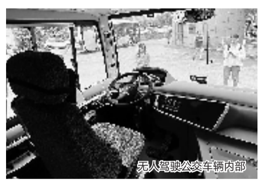
无人驾驶公交车内部