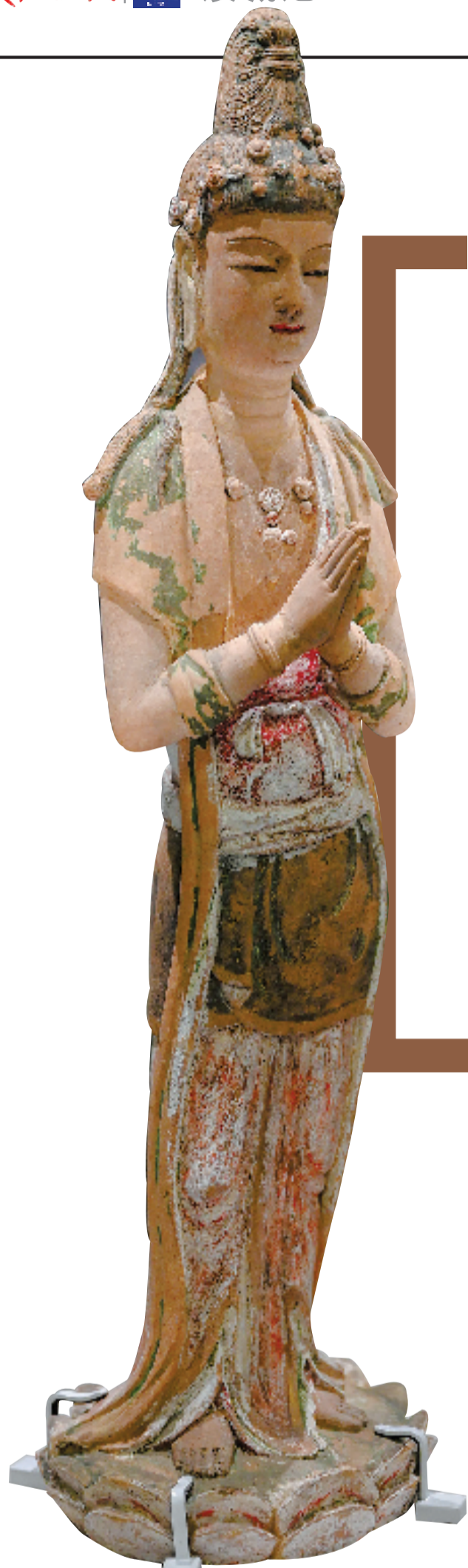
泥塑彩绘菩萨立像