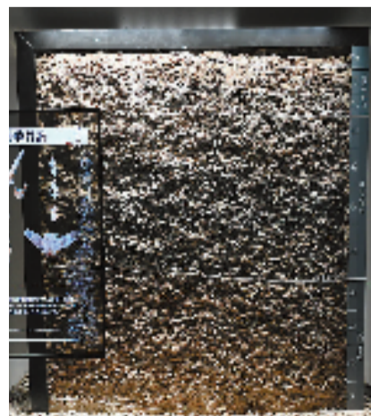
井头山遗址贝壳堆积剖面

孙国平说,这次从工地拉了20筐贝壳标本布展,“中国人吃海鲜的时间,通过井头山遗址的考古后才敢相信,至少也已有八九千年的历史。而且,井头山遗址出土的海鲜遗存中还有很多螃蟹壳和螃蟹钳,所以常说的第一个吃螃蟹的人,也无疑是宁波人。”