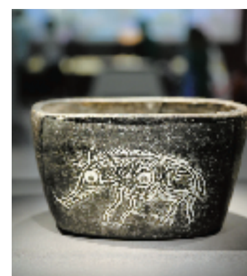
猪纹陶钵正面