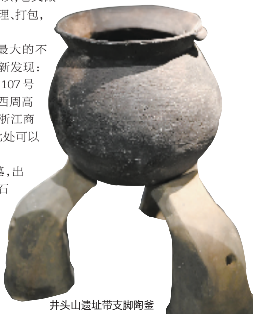
井头山遗址带支脚陶釜

尤其是孟姜村土墩墓,出土了大量青铜车马器、玉石器、原始瓷器、陶器等随葬品。这次在浙博之江馆首次展出了5枚玉块和20件陶纺轮,虽然数量不多,只有一个展柜,也是“新鲜出炉”,先睹为快。