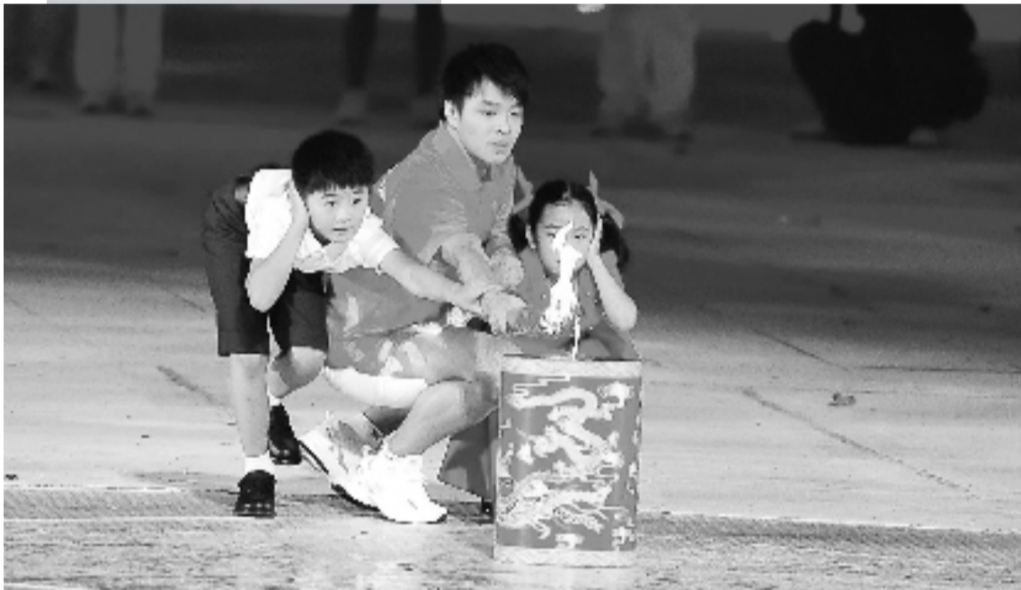
广州亚运会点火仪式