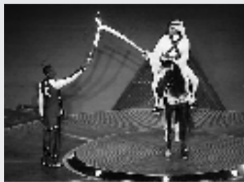
多哈亚运会点火仪式

让你印象最深刻的圣火点燃名场面是哪次?是体操王子李宁在“鸟巢”飞檐走壁,点燃了中国的奥运梦;还是拳王阿里颤抖着双手点燃圣火,让奥林匹克精神的传承生生不息?放眼亚洲,72年光阴,18届亚运会历程,也有不少火炬点燃的难忘瞬间,一起来回顾。