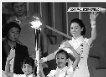
仁川亚运会点火仪式