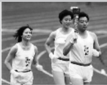
北京亚运会点火仪式