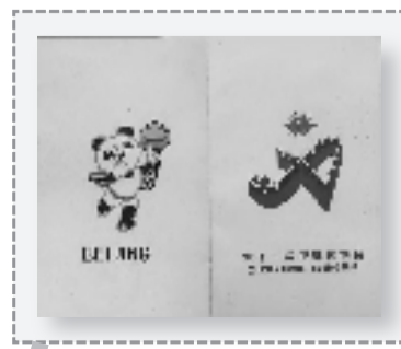
北京亚组委出具的回执