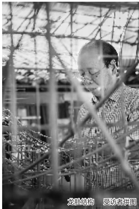
龙肚结构