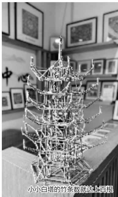
小小白塔的竹条数就达上百根