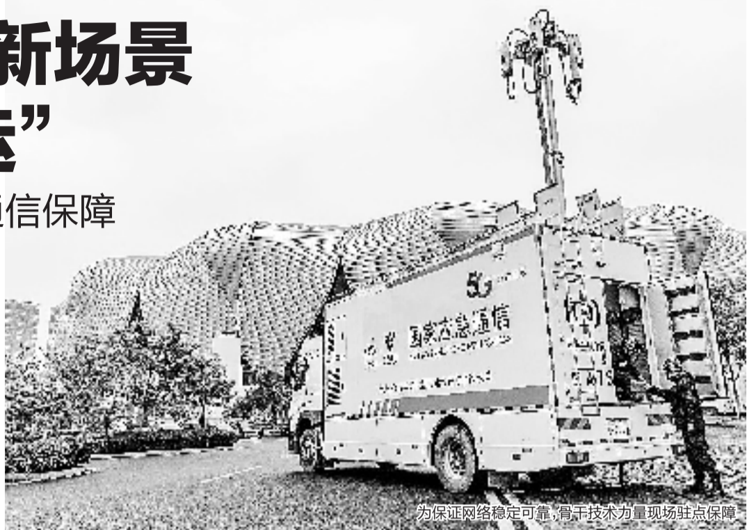
为保证网络稳定可靠,骨干技术力量现场驻点保障