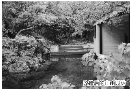
改造后的山山园林

建筑,一年后造园完成了,没想到那建筑属于违章建筑,遭遇拆除,交了一笔学费。后来我们继续找地,但附近闲置用地都租掉了,只剩一处废弃矿坑没人要。”